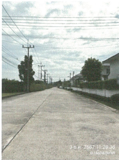
รูปภาพที่ 2.3 สีอาคารของโครงการ