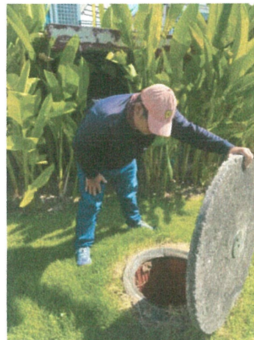
รูปภาพที่ 2.17 การตรวจสอบการทำงานของระบบบำบัดน้ำเสีย