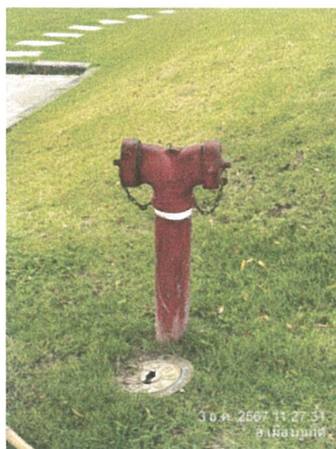
รูปภาพที่ 2.22 หัวรับน้ำดับเพลิง