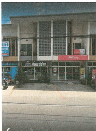
รูปภาพที่ 2.7 เส้นแบ่งช่องสำหรับจอดรถบริเวณหน้าอาคารพาณิชย์