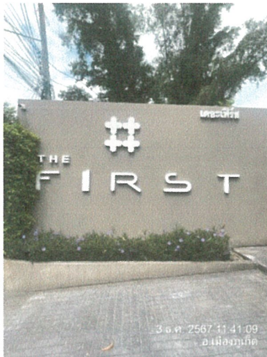
รูปภาพที่ 2.5 ป้ายโครงการ