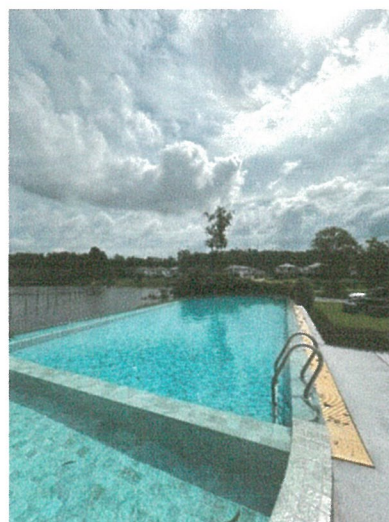
รูปภาพที่ 2.12 สระน้ำของโครงการ