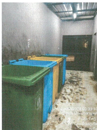
รูปภาพที่ 2.18 ถังขยะแยกประเภท