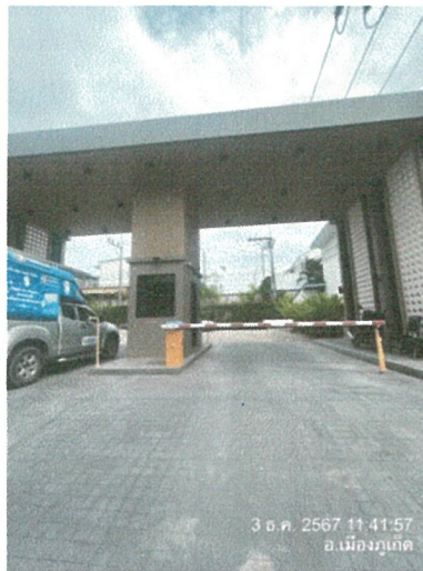
รูปภาพที่ 2.9 ไฟฟ้าส่องสว่างบริเวณทางเข้า-ออก