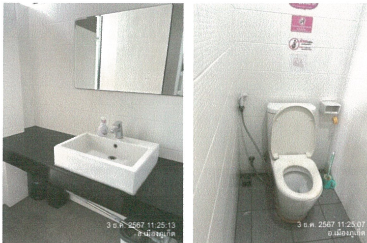
รูปภาพที่ 2.13 สุขภัณฑ์ประหยัน้ำ