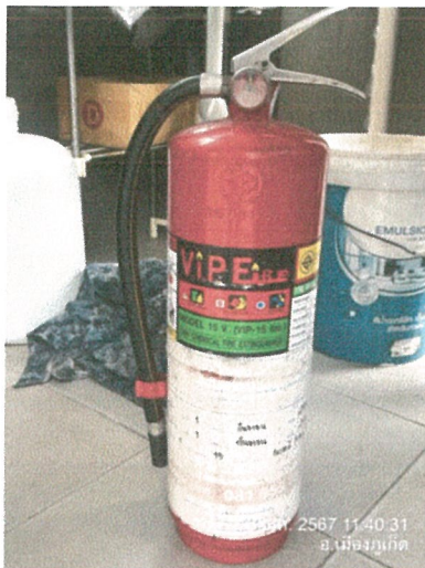
รูปภาพที่ 2.24 ถังดับเพลิง