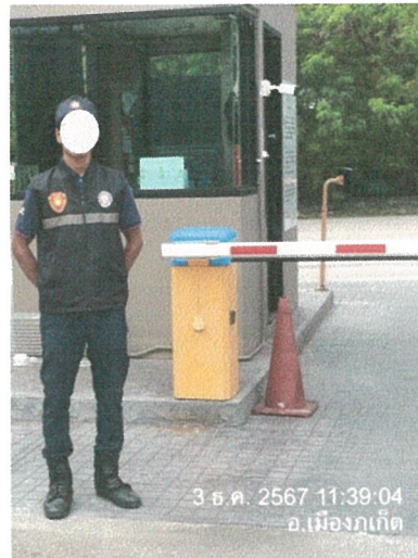
รูปภาพที่ 2.6 เจ้าหน้าที่รักษาความปลอดภัย