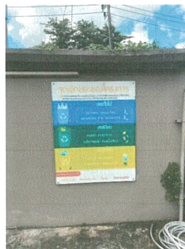
รูปภาพที่ 2.19 ป้ายรณรงค์คัดแยกขยะมูลฝอย