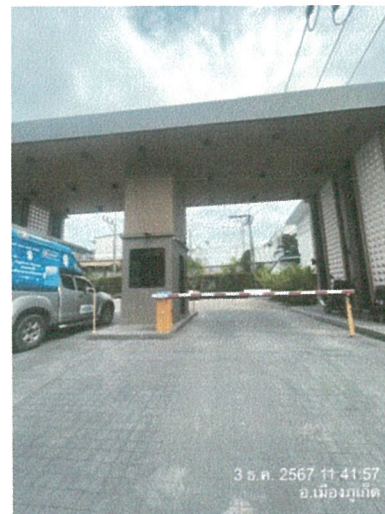
รูปภาพที่ 2.8 ทางเข้า-ออกโครงการ