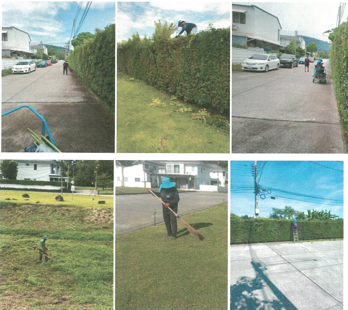
รูปภาพที่ 2.2 งานดูแลสวน