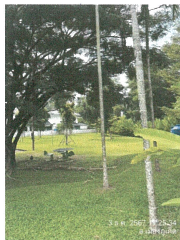
รูปภาพที่ 2.23 พื้นที่จัดรวมพล