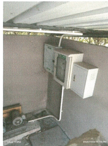
รูปภาพที่ 2.16 ระบบบำบัดน้ำเสีย