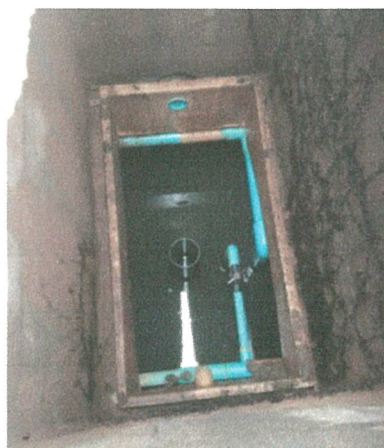
รูปภาพที่ 2.15 การขุดลอกตะกอน