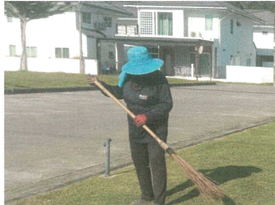
รูปภาพที่ 2.10 การกวาดพื้นถนน