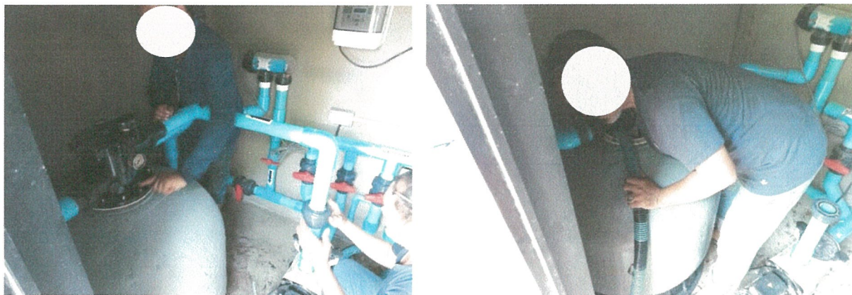
รูปภาพที่ 2.14 การตรวจสอบระบบท่อจ่ายน้ำ