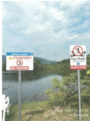
รูปภาพที่ 2.4 เสาตาข่ายกันแนวเขตที่ดิน