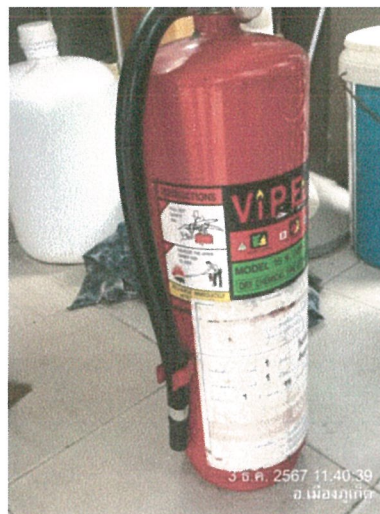
รูปภาพที่ 2.25 วิธีการใช้ถังดับเพลิง