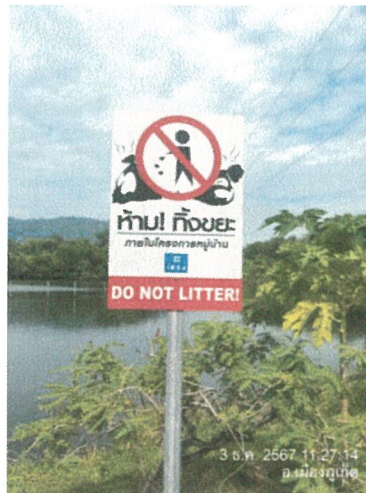
รูปภาพที่ 2.20 ป้ายห้ามทิ้งขยะภายในโครงการ