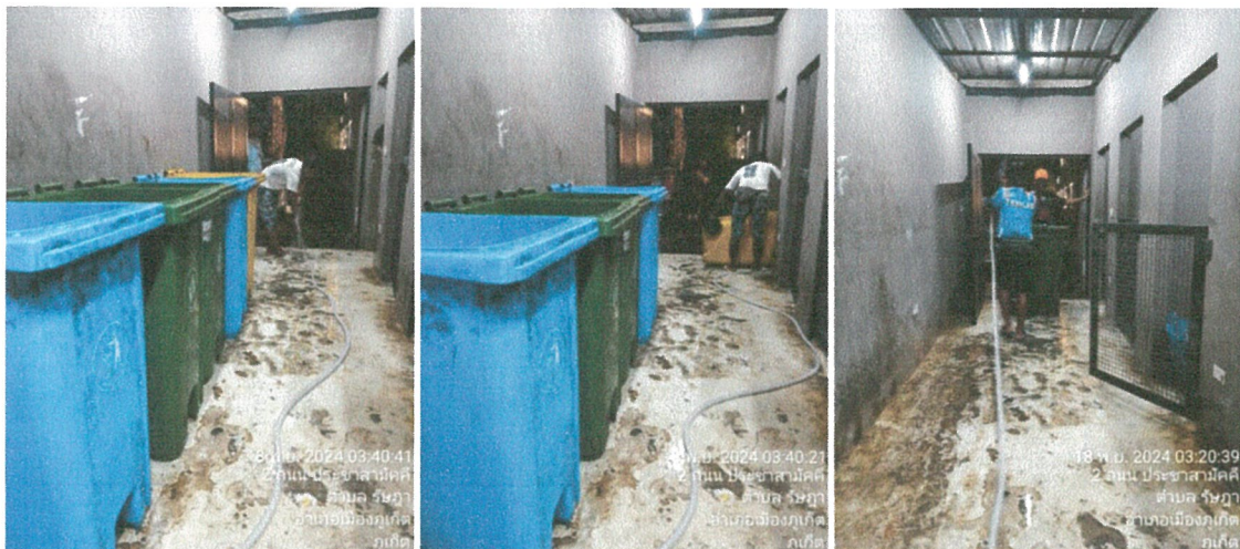
รูปภาพที่ 2.21 การล้างทำความสะอาดห้องพักรวม