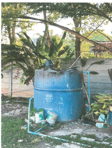
รูปภาพที่ 2.11 ถังเก็บน้ำสำรอง